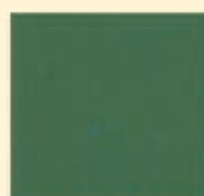
VERDE SCURO RAL 6005 V 04