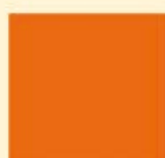
ARANCIO RAL 2004 V 16