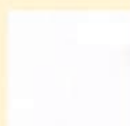
BIANCO RAL 9003 V 15