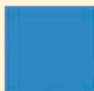
BLU RAL 5010 V 12