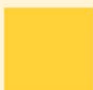
GIALLO RAL 1021 V 14