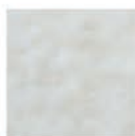
MARBRE DE GENES