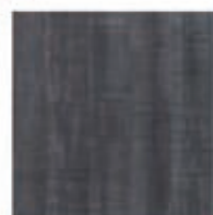
PALISSANDRO GRIS CENDRE