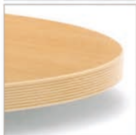
BORDO ABS COLORE LEGNO MULTISTRATO