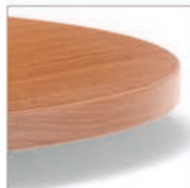
BORDO ABS COLORE NOCE CHIARO