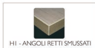
H1 - ANGOLI RETTI SMUSSATI