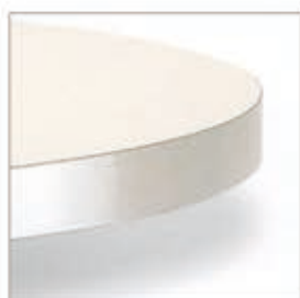
BORDO ABS GRIGIO