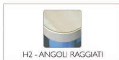
H2 - ANGOLI RAGGIATI