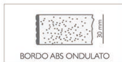
BORDO ABS ONDULATO